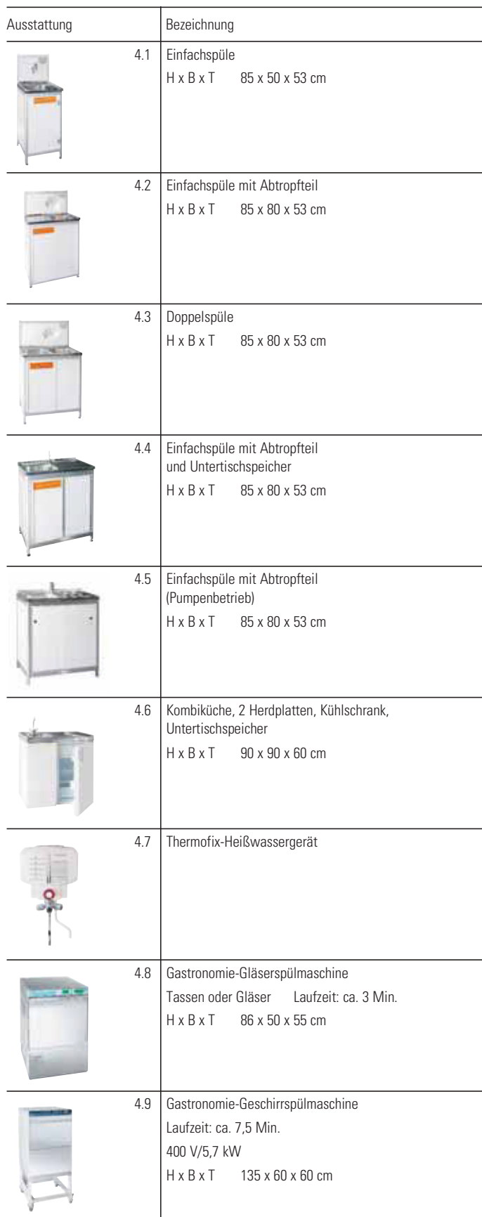
Illustration der Mietgeräte